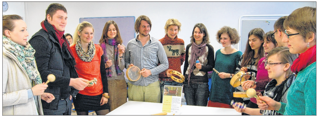
Angehende Lehrerinnen und Lehrer befassten sich auch auf spielerische Weise mit dem Thema Medienkompetenz und deren optimaler Vermittlung im Unterricht.